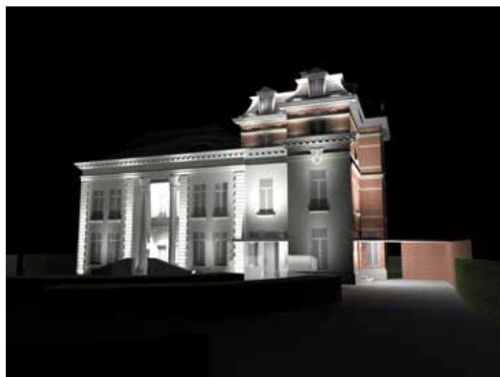
▲ Kasteel Broydenborg met nieuwe verlichting

Het eerste pand in de kijker is het Kasteel Broydenborg, dat een aangepaste en sfeervolle verlichting krijgt. Zodra het begint te schemeren, zal dit kasteel daardoor veel beter tot zijn recht komen en zo onrechtstreeks ook een bijdrage leveren in de