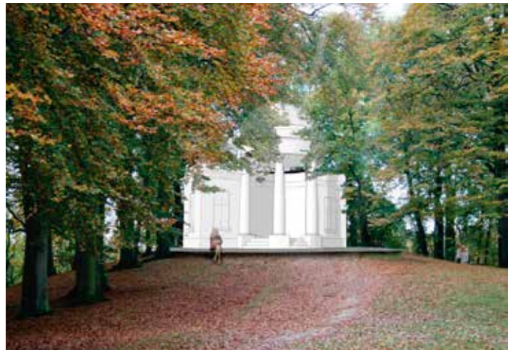
▲ Sfeerbeeld Belvédère na restauratie

© Tv Bormans Rozemarijn- Karuur architecten bvba