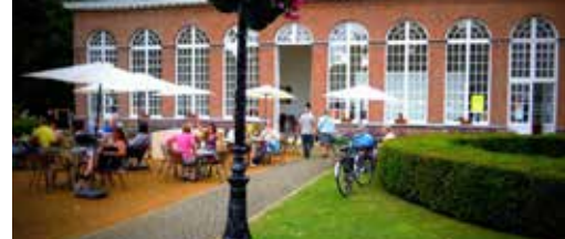
Zomerbar terug van start p. 2