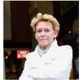
▲ Kathelijne Toen Districtsburgemeester

Na de restauratie zoekt het district Hoboken een creatieve invulling voor de Belvédère. Gedacht wordt aan een vertelruimte voor kinderen, open ateliers voor kunstenaars of exporuimte. Het kan verder ook benut worden als ceremonieruimte voor huwelijksceremoniën of inhuldigingen. Mogelijkheden genoeg dus.