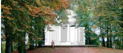
Restauratie Belvédère gaat van start p. 2