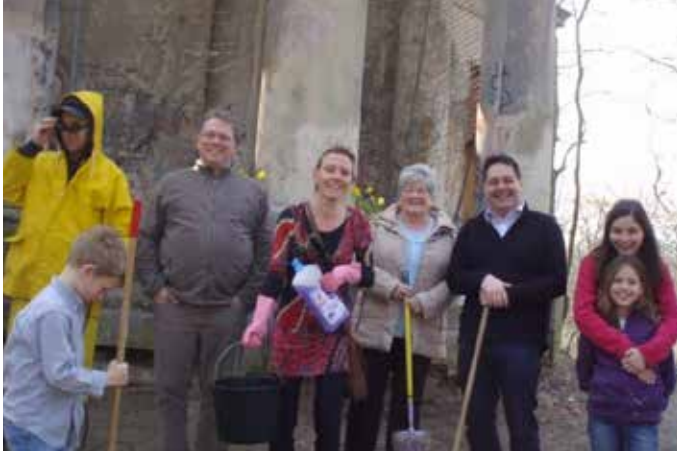
▲ Lentepoets Belvédère in 2011

Dit bekende paviljoen in park Sorghvliedt verkeert al jaren in een zorgwekkende toestand, tot ergernis van velen. N-VA Hoboken ijvert er al jaren voor om het paviljoen in ere te herstellen. Het is per slot van rekening een stukje erfgoed waar menig Hobokenaar goede herinneringen aan heeft.