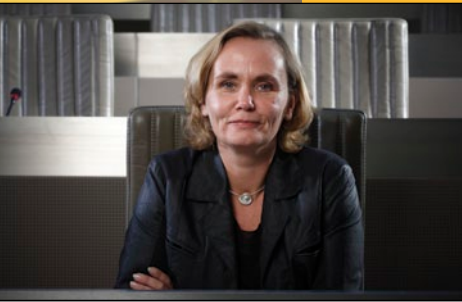
Vlaams parlementslid Liesbeth Homans liesbeth.homans@n-va.be

Steeds meer Antwerpse kinderen volgen thuis les in plaats van op school. Dat kan omdat Vlaanderen leerplicht kent en geen schoolplicht. De cijfers die Vlaams parlementslid Liesbeth Homans van Onderwijsminister Pascal Smet kreeg over dit huisonderwijs, deden echter haar wenkbrauwen fronsen.