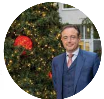
Bart De Wever Burgemeester

Ik wens u en uw naasten van harte een gezellig eindejaar en een fijn nieuwjaar toe, vol gezondheid en geluk. Draag zorg voor elkaar.