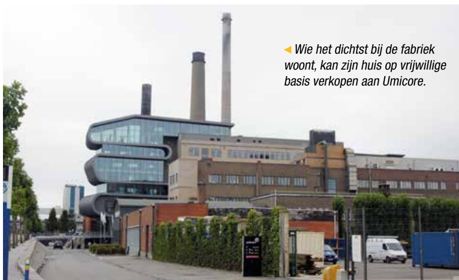
◀ Wie het dichtst bij de fabriek woont, kan zijn huis op vrijwillige basis verkopen aan Umicore.