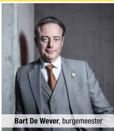
Bart De Wever, burgemeester

“In de strijd tegen drugsgeweld doe ik wat ik moet doen als burgemeester: de veiligheid van alle Antwerpenaars bewaken en zorgen dat onze straten niet het decor worden voor afrekeningen van de drugsmaffia. Met Operatie Nachtwacht controleert de politie iedereen die 's nachts in de getroffen wijken op straat komt. Dat leidde al tot een 50-tal arrestaties en de politie nam auto's, wapens, drugs en cash geld in beslag. Mijn oproep aan de nieuwe federale regering: neem ook uw verantwoordelijkheid en bestrijd de internationale georganiseerde misdaad met meer middelen en mankracht.”