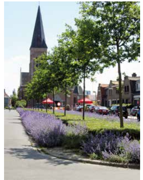
▲ Het is zoeken naar een evenwicht tussen bewoning en economie in Moretusburg.

De oplossing die uit de bus gekomen is, is er ééntje uit de oude doos. In het verleden werd er ook al eens geopperd om een groene bufferzone aan te leggen en nu werd er finaal ook voor die piste geopteerd, zij het op vrijwillige basis. Wie in Moretusburg woont in de zone het dichtst tegen de fabriek, kan zijn pand verkopen aan Umicore tegen een waarde die hem in staat moet stellen elders een gelijkaardige woning te kopen. Umicore zal die aangekochte panden vervolgens afbreken om er finaal een grote groene bufferzone van te maken.