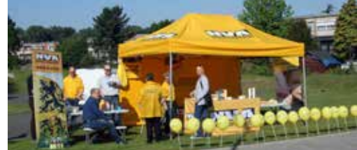
N-VA Hoboken Toert p.2