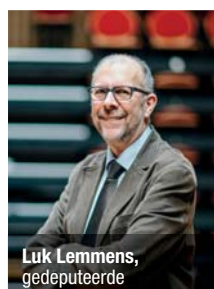
Luk Lemmens, gedeputeerde